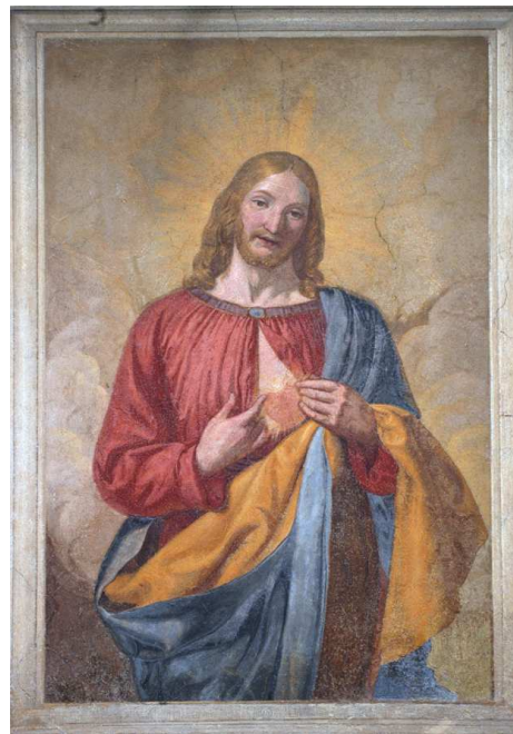
Figg. 2 e 3. Pompeo Girolamo Batoni, Il Sacro Cuore di Gesù e l’affresco inzaghesa