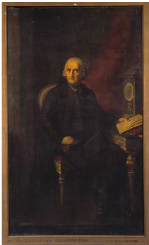
Fig. 6. Perabò Giovanni Battista, ritratto dell’abate Giuseppe Catenacci

SUB AUSPICIIS DOLENTISSIMA MATRIS REQUIEM EXPECTAT JOSEPH ABBAS CATENACCI OBIIT DIE XVIII SEPTEMBRIS MDCCLXXXVI AETATIS ANNORUM NONAGINTA