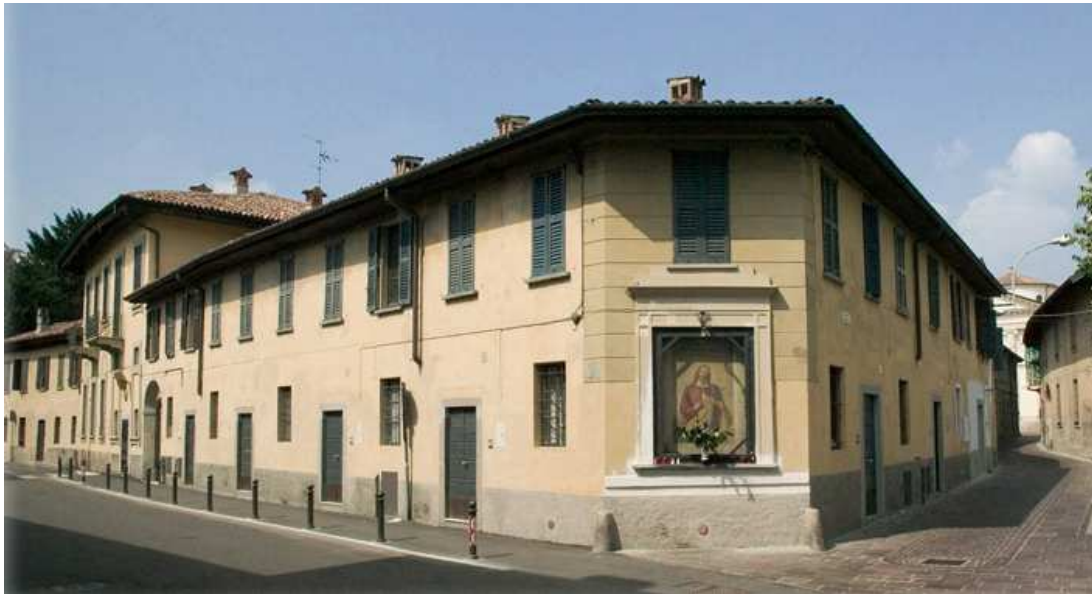
Fig. 1. Casa Ugenti Sforza

La recente pubblicazione di due volumi di Sara Valtorta, Luigi Minuti, Walter Venchiarutti e Paolo Origgi dedicati al Culto del Sacro Cuore, Iconografia locale e Iconofilia internazionale , terzo Quaderno di Antropologia Sociale, presentati il 7 giugno 2011 dal Centro Studi Storici della Geradadda, mi ha motivato ad aggiungere all'analisi delle testimonianze di tale culto nell'area cremasca e della Geradadda anche quella relativa ad un dipinto votivo oggi situato all'angolo di Casa Ugenti Sforza tra le vie Umberto I e Roma di Inzago.