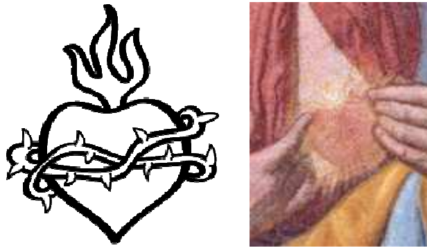
Figg. 4 e 5. Il Sacro Cuore con le spine, la fiamma ardente e particolare dell'affresco inzaghesse

L'iconografia dei due dipinti è simile: il primo ha influenzato il secondo che, essendo un affresco, è meno curato nei dettagli, ma la differenza più evidente sta nella impostazione generale. Il Sacro Cuore di Gesù è posto da Batoni in primo piano a se stante, avulso chiaramente dal corpo del Salvatore, con la fiamma ardente d'amore e carità e le spine che lo avvolgono per i peccati commessi dagli uomini. Il dipinto inzaghesse pone invece in primo piano la figura del Cristo con il cuore che emerge senza tridimensionalità e quasi timidamente sul petto in corrispondenza della posizione reale; le spine non sono presenti nell'affresco inzaghesse.